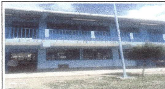
Foto 4: balcones instalada en la parte frontal del edificio escolar en los dos niveles.