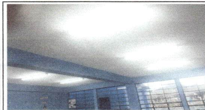
Foto 3: lámparas cambiadas en las aulas del primer y segundo nivel